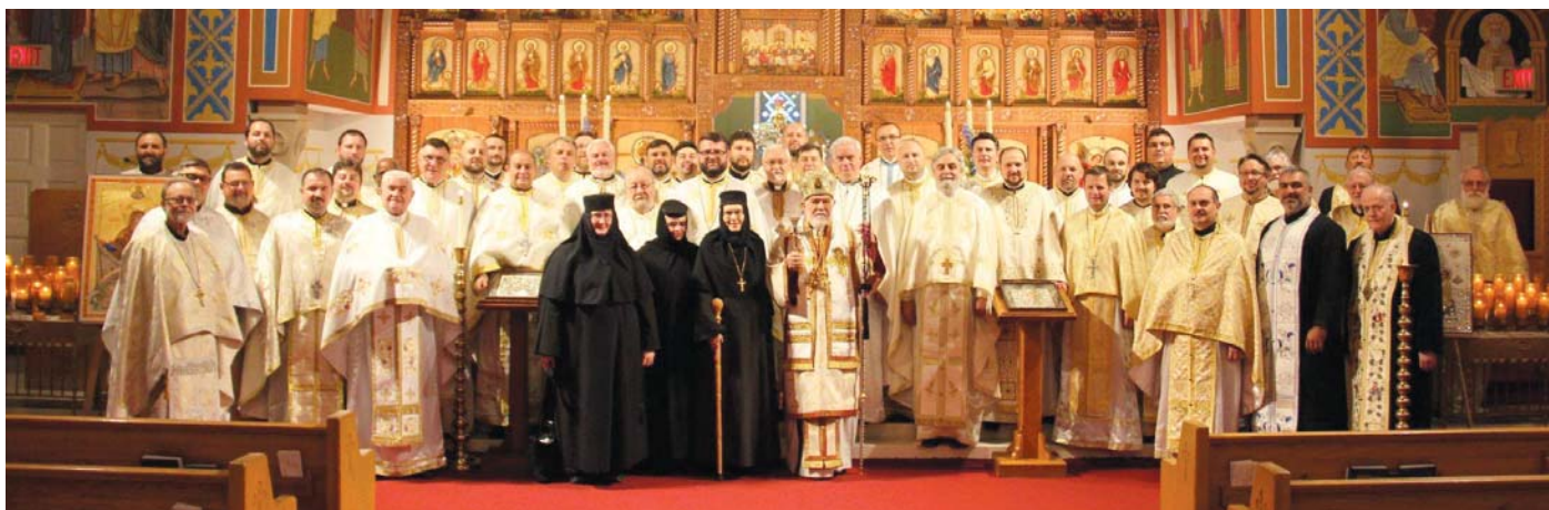
Archbishop Nathaniel is surrounded by clergy and monastics following the Hierarchal Divine Liturgy on Sunday.