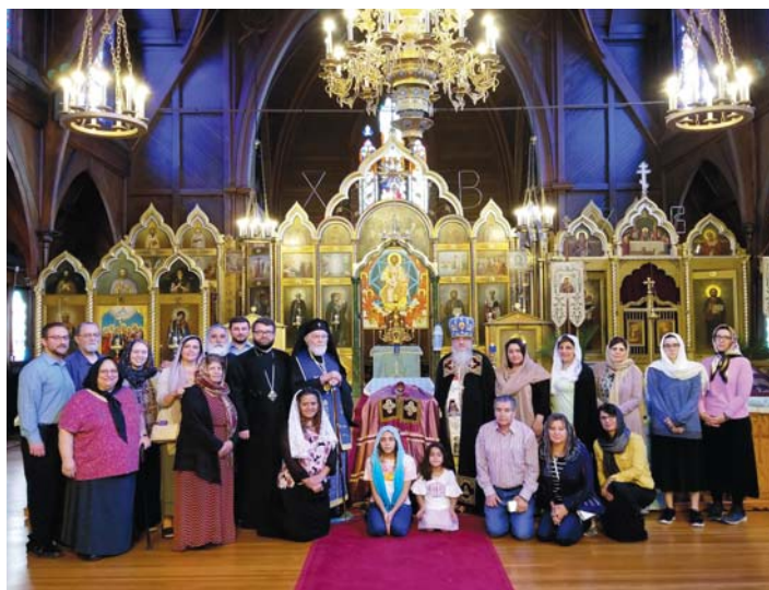
Rugăciune în Catedrala Veche din San Francisco unde a slujit Sf Ioan Maximovici.