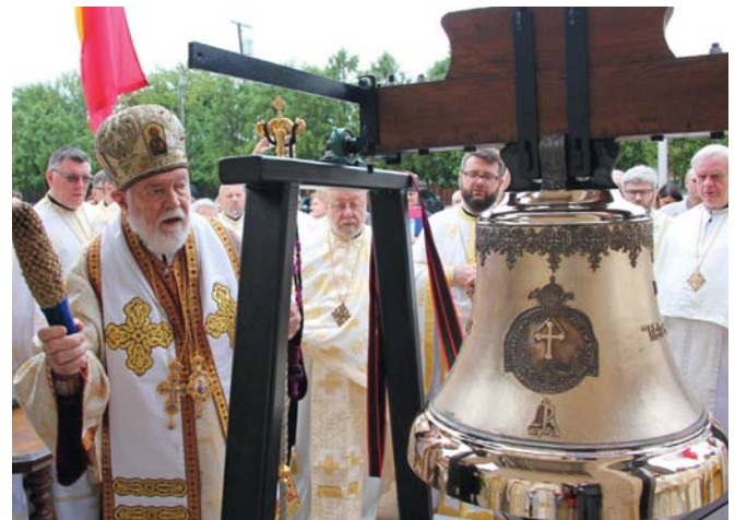
Archbishop Nathaniel blesses the 90th Anniversary Bell following the Hierarchal Divine Liturgy.