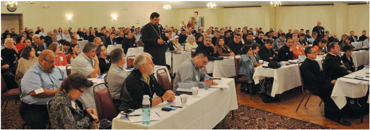
Delegates in Session

increase of the parish membership dues with $10 per capita, effective January 2020, to create the respective salary. The Congress took note also of the progress of the Vatra Generations project, that is intended to restore and preserve the historical buildings of the Residence and Grey Tower of our Vatra Românească . The administrative Congress was spread into two sessions, held both on Friday afternoon and Saturday morning/afternoon. The new Episcopate Council and Church Tribunal were also elected and sworn in.