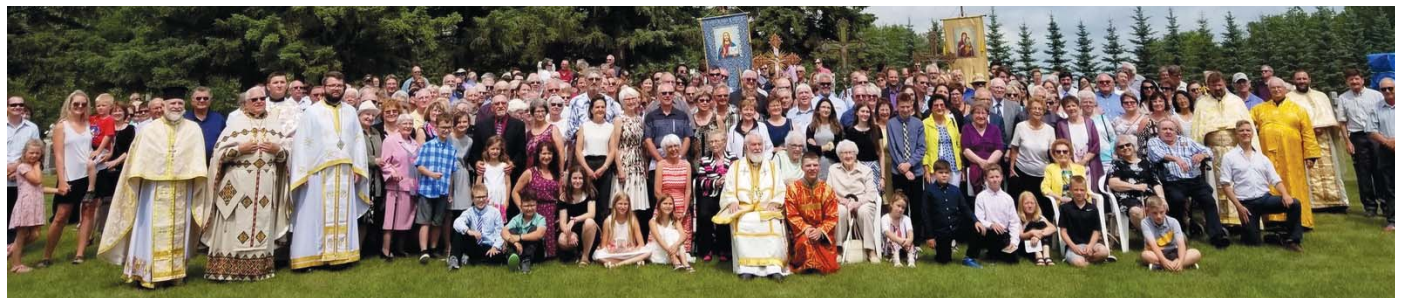
Aniversarea de 100 de ani a Parohiei Sf Ioan Botezătorul, Shell Valley, Manitoba, Canada - 7 iulie 2019 - peste 500 de credincioși veniți din toată Canada au participat la acest eveniment.